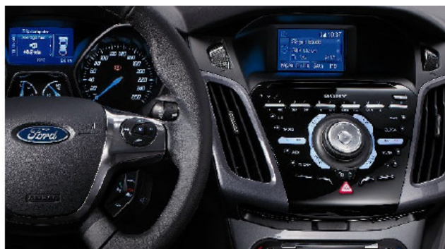
Aukščiausios kokybės salonas