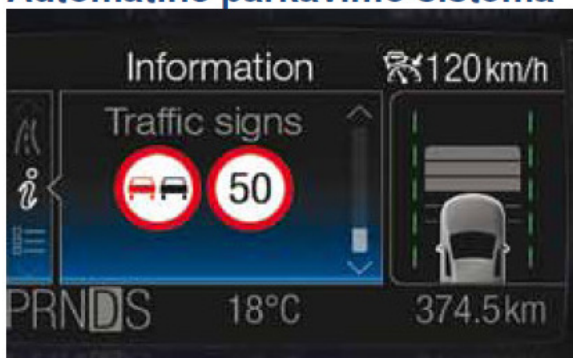
Kelio ženklų atpažinimo sistema