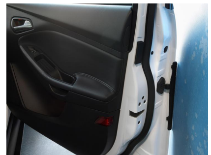
**Automatinės automobilio šoninių durelių apsaugos