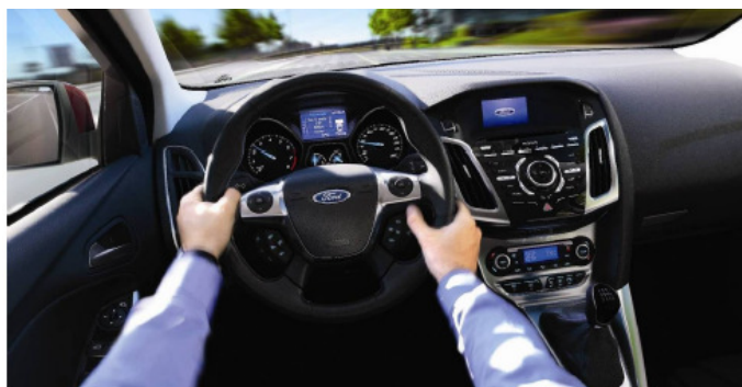
Automatinė parkavimo sistema