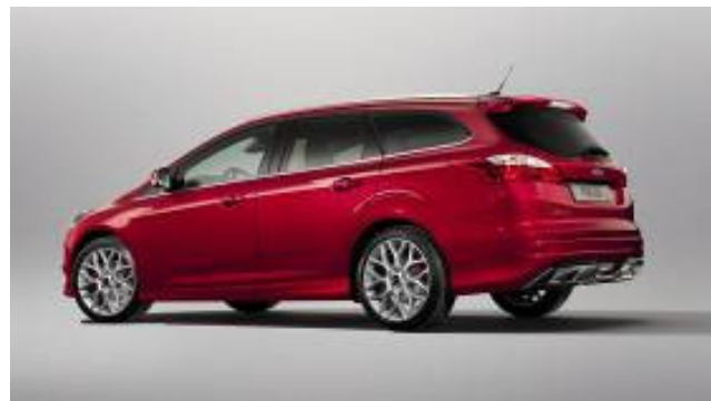
*Ford Individual kėbulo apdailos elementų paketas